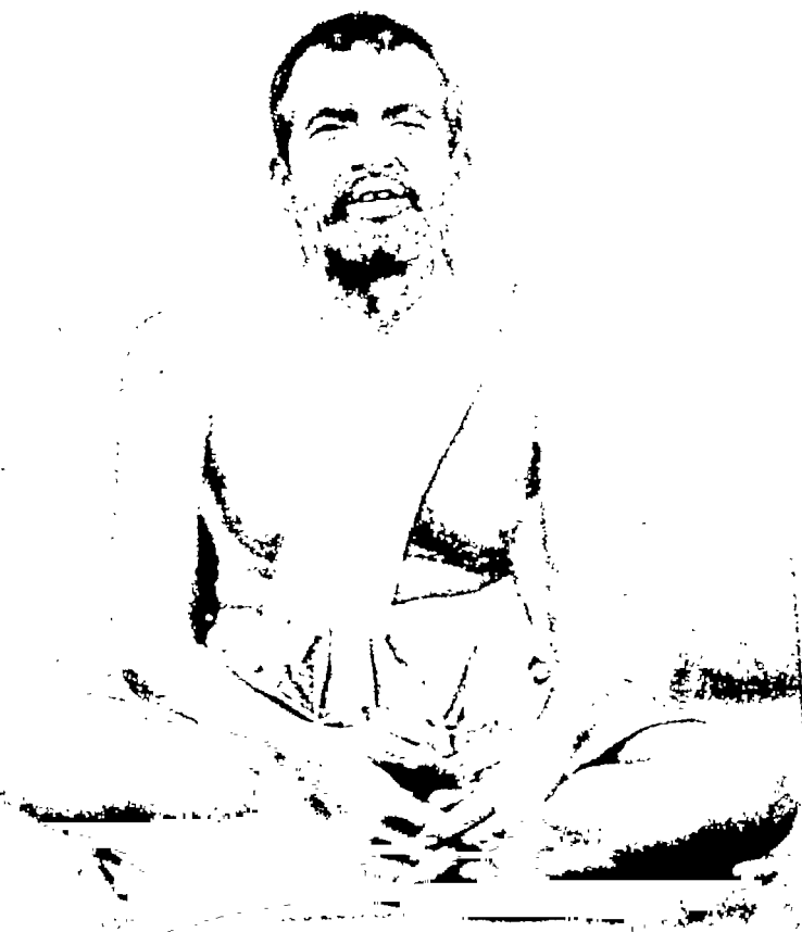
भगवान श्रीरामकृष्ण देव